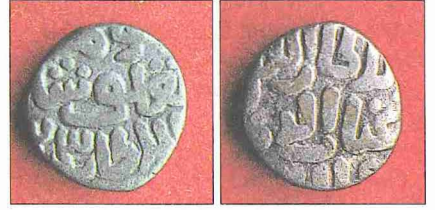
Gıyâseddin Tuğluk'a ait bir gümüş sikke (İstanbul Arkeoloji Müzesi, Teşhir, nr. 2551)

Halaciler'den Alâeddin Muhammed Şah zamanında (1296-1316) orduya giren Gıyâseddin Tuğluk, sultanın kardeşi Uluğ Han Elmas tarafından önce yaya, sonra da atlı sınıfına kabul edildi. Kısa zamanda kendinin göstererek mirâhurluğa yükseldi. Bu sırada Halaciler buhranlı günler yaşamaktaydılar. Zira Afganistan'dan Sind ve Pencap'a inen Moğol orduları her yeri yakıp yıkıyor ve fırsat buldukça Delhi'ye doğru akınlar düzenliyorlardı. Tuğluk bu dönemde onlarla mücadeleye girdi ve büyük başarılar kazandı. Dipâlpûr valiliğine tayin edilince (1315) Moğol tehdidini önledi. Hatta Afgan geçitlerini aşip baskınlar düzenleyerek onlara ağır kayıplar verdirdi. Bu başarısı ona büyük itibar kazandı ve Sind'de Melik Gazi unvanıyla üne kavuştu. İbn Battûta, Mülta'n'da bir caminin mahfilindeki kitâbede, "Ben yirmi dokuz defa Tatarlar ile savaşarak onları