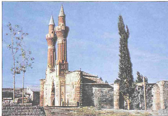
Sivas Gökmedrese ve planı

Cephede taçkapı üzerine inşa edilen iki minare, tabana kadar inen ve taçkapı ile bütünleşen süslemeli kaideleriyle tam bir simetrik uyum içindedir. Yivli olan minarelerin yivlerinin arası, birkaç