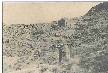
Gördüs Kalesi'ndeki Osmanlı dönemi müslüman mahallesinin kalıntıları: Önde Fâtih Sultan Mehmed Camii'nin minare kâidesi ile arka planda Ahmed Paşa Camii harabesi

XVII. yüzyılda Gördüs Mora'nın en önemli İslâmî merkezlerinden biri haline geldi. Bu döneme ait en ayrıntılı bilgi, 1667'de burayı gören Evliya Çelebi tarafından verilmektedir. Şehrin adının Koritoz'dan (Korinthos) bozma Gördüs olduğunu, Atina körfeziyle İnebahtı körfezi arasında her iki tarafı da rahatça görebilecek bir tepenin üzerinde sekizgen şekilli bir kalesi bulunduğunu belirten Evliya Çelebi, kalenin aşağı kısmında 200 hıristiyan hânenin, bir duvarla ayrılmış üst kısmında ise 200 müslüman hânenin varlığından söz eder. Ona göre burada Sultan Mehmed, Beyzâde, Ahmed Paşa ve Fethiye adlarını taşıyan dört cami vardı. Ayrıca varoş olarak nitelendirildiği, kalenin aşağı kısmına doğru uzanan düz kesimde de 500 hânenin bulunduğunu belirtmektedir. Bu kısımda da cuma namazı kılınabilen üç cami (Mehmed Çavuş Camii, Tekke Camii ve Zorba Camii), 100 dükkân, iki han ve bir hamam mevcuttu. Halk Rumca ve Arnavutça konuşuyordu, fakat Rumca daha yaygındı. Kalede 200 muhafız görev yapıyordu ( Seyahatnâme , VIII, 275-282). Evliya Çelebi'den sonra Jacob Spon ve George Wheler de Gördüs'ü ziyaret ettiler. Spon ve Wheler'e göre toplam hâne sayısı 1500 civarındaydı ve bunun ya-