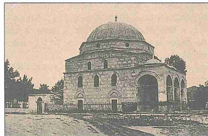
İmrâhor İlyas Bey Camii - Görice / Arnavutluk

XVIII. yüzyılın ikinci yarısında Eflak ticaret metropolü Voskopoye'den (Voskopojë) gelen hıristiyan göçmenlerle Görice'de hayat biraz daha canlanmıştır. 1783'te Görice Tepedelenli Ali Paşa'nın denetimine geçmiştir. Fransa'nın Selânik konsolosu Felix Beaujour ve İngiliz seyyahı William Martin Leake'e göre XIX. yüzyılın ilk yarısında Görice'de 450 hânede yaklaşık 3000 nüfus vardı. J. G. von Hahn, XIX. yüzyılın ortalarında Görice'nin hızla geliştiğinden bahsetmektedir ( Albanische Studien , s. 55). Diğer bazı kaynaklarda 1859'da burada 10.000 kişinin yaşadığı zikredilir. Şemseddin Sâmî, XIX. yüzyılın son on yılında Görice nüfusunun 18.000 olduğunu ve şehirde 757 dükkân, yirmi üç han, iki cami, bir imaret, iki hamam, bir saat kulesi ve