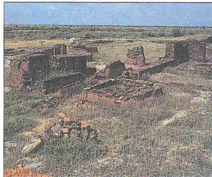
Gucerât'ın Lothal bölgesindeki arkeolojik kazılarda ortaya çıkarılan eski bir yerleşmeye ait mimari kalıntılar - Hindistan

Bahadır Şah'ın ardından tahta çıkan III. Mahmud Şah ikametgâhını 1546'da Mahmudâbâd'a taşıdı. Onun 1554'te öldürülmesinden sonra devletin ileri gelenleri sultanlığı kendi aralarında paylaştılar. Bunların en güçlüsü itidâ etmiş bir Hindü olan İ'timâd Han'dı. Bu arada Dâmân Limanı da Portekizliler'e terk edilmiş, Timur soyundan gelen birçok şehzadenin Gucerât'a sığınması durumu daha da zorlaştırmıştı. Karışıklıkların artması üzerine İ'timâd Han, Gucerât'ı istilâ etmesi için Bâbürlü Hükümdarı Ekber Şah'ı davet etti. Ekber Kasım 1572'de Gucerât'a vardı. Ona karşı koymak için asilzadelerin yaptığı bütün teşebbüsler başarısızlıkla sonuçlandı ve Gucerât Bâbürlü Devleti'nin bir eyaleti haline getirildi. Ekber Şah'ın geri dönmelerinden kısa bir müddet sonra Gucerât'ın ileri gelenleri Bâbürlüler'e isyan ettiler. Bunun üzerine Ekber Şah derhal Gucerât'a hareket etti; dokuz günde Ahmedâbâd'a ulaşarak isyanı bastırdı ve Bâbürlü hâkimiyetini sağlamlaştırdı. Böylece yaklaşık iki asır hüküm süren Gucerât Sultanlığı'nın bağımsızlığına son verilmiş oldu. Bu iki asır boyunca on üç sultan tarafından idare edilen Gucerât en parlak devrini Bahadır Şah zamanında yaşadı. Hint deniz yolunun Avrupalılar tarafından keşfi ülkenin baharat ticaretini geliştirdiyse de Portekiz tehlikesine de yol açmış; Portekizliler'in kurduğu Diü, Dâmân, Bassain ve Bulsar gibi askerî üs ve koloniler Gucerât Sultanlığı için büyük bir tehlike teşkil ederek