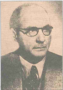
Muhammed Şefik Gurbâl

Eserleri. 1. The Beginnings of the Egyptian Question and the Rise of Mohamed Aly (London 1928). Mısır meselesinin başlangıcını ve Kavalalı Mehmed Ali Paşa'nın yükselişini konu edinen yüksek lisans tezidir. 2. Muhammed 'Alî el-Kebîr (Kahire 1944). Kavalalı Mehmed Ali Paşa'nın hayatı ve icraatı hakkındadır. 3. el-Mufâvađâtü'l-Briđâniyye mine'l-ihtilâl ilâ mu'âhedeti sene 1936 (Kahire 1952). İngilizler'in 1882 yılındaki işgalinden 1936'daki bağımsızlık antlaşmasına kadar İngiltere ile yapılan müzakereleri ele alan eser bu konuda yazmayı planladığı bir dizi kitabın ilki olarak yayımlanmış, fakat gerisi gelmemiştir. 4. Tekvînü Mısır (Kahire 1957). Gurbâl'in "The Making of Modern Egypt" adı altında yaptığı on radyo konuşmasının Arapça tercümesidir. 5. Minhâcün mufaşşalün li-dirâseti'l-âvâmili't-târîhiyye fi binâ'i'l-ümmeti'l-Arabiyye 'alâ mâ hiye 'aleyhi'l-yevm . Ma'hedü'd-dirâsâti'l-Arabiyyeti'l-âliye'de verdiği derslerden derlenen kitap, bugünkü Arap milletinin oluşumunu sağlayan tarihî faktörler üzerinde durur (bk. M. Ferîd Ebû Hadîd, XV [1963], s. 156). Gurbâl, "Ideas and Movements in Islamic History" ( Islam. The Straight Path Islam as Interpreted by Muslims , nşr. K. W. Morgan, New York 1958, s. 42-86) adlı makalesinde ise İslâm tarihindeki fikrî cereyan ve hareketler hakkında bilgi vermektedir.