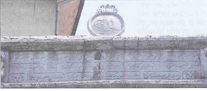
Gureba Hastahanesi Cami'i'nin avlu kapısı üzerindeki kitâbe

fili, kapısından geçişin sağlandığı bir duvarla hünkâr mahfilinden ayrılmıştır. Hünkâr mahfilinin öne doğru oval bir çıkıntı oluşturan kafesli kısmı, yakın zamanlarda beton bir duvarla kapatılarak ana ibadet mekânının görülmesi engellenmiştir. Ahşap tavanın ortasında yaprak şeklinde yaldızlı bir göbek, diğer taraflarında da serpiştirilmiş vaziyette yine yaldızlı bitki motifleri görülmektedir. Sivri külahlı minber, devrinin ahşap oymacılığının güzel örneklerinden biridir. Mihrap bordürü yivli olup yivlerin üst kısmında barok üslûbunda kıvrımlar yer alır. Caminin en önemli mimari özelliği, yanındaki hastahanein içinden merdivenle çıkılan ve bir pencerenin arkasında hastaların da cemaate katılmalarına imkân veren 20 m 2 'lik üçüncü bir mahfilinin bulunmasıdır. Bu mekânın, son cemaat yerine açılan ayrı bir kapısı daha varsa da bugün bir duvarla kapatılmış durumdadır.