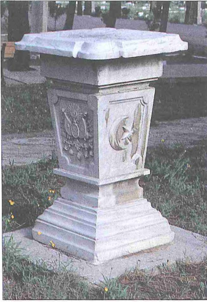
Edirnekapı Şehitliği'ndeki yatay güneş saati - İstanbul

din Mahmud Zengî için 1160 yılında yaptığı, Uluğ Bey'in Semerkant'taki sarayının duvarına yerleştirilen saatler zikredilebilir.