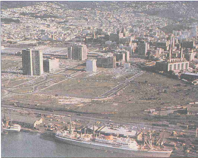
Cape Town sehrinden bir görünüş - Güney Afrika Cumhuriyeti