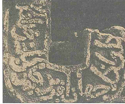
Selçuklular devrine ait pehlivan taşının iki yüzü (Ankara Etnografya Müzesi, nr. 13065)

dişah olunca bunları İstanbul'a götürerek bir bölük halinde toplamıştır. Yavuz Sultan Selim zamanına ait ehl-i hıref defterinden "cemâat-i küştigîrân" denilen bir güreşçiler topluluğunun bulunduğu ve Ali Küçük, Hacı, Kemal Acem, Şahkulu, Mehmed Divane, Ali Rum ve Ali Zorbaz gibi pehlivanların yetiştiği öğrenilmektedir (Uzunçarşılı, XI/15, s. 60). Bunlardan Ali Küçük'ün 1000 kuruş maaş aldığı ve öteki güreşçilere hocalık yaptığı anlaşılmaktadır. Ünlü nişancı ve tarihçi Celâlzâde Mustafa Çelebi, Tabakâtü'l-memâlik 'inin birinci tabakasının on dokuzuncu derecesini pehlivanlar zümresine ayırmış, fakat eserin bu bölümü günümüze ulaşmamıştır. Kanûnî Sultan Süleyman zamanında da önemini koruyan güreş sporu daha sonra ihmale uğramıştır. Nitekim XVI. yüzyıl sonlarında bir güreşçi tarafından yazılmış arzuhalde padişahın eskisi gibi pehlivanlara önem verilmesinin istendiği görülmektedir (TSM, nr. E. 8532). IV. Murad zamanında güreşçilerin Birün'dan Enderun'a alındığı ve bu padişah döneminde kurulan Seferli Koğuşu'nda güreşçilerin de bulunduğu anlaşılmaktadır (Mehmed Halife, s. 25-26). IV. Mehmed devrinde Enderun-