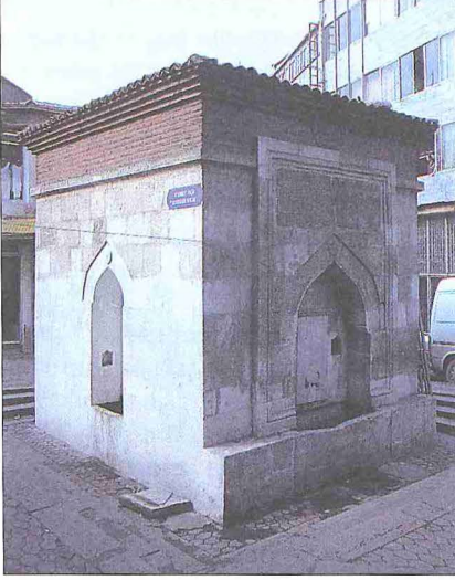
Güzelce Mahmud Paşa Çeşmesi - Mahmutpaşa / İstanbul

Kesme küfeki taşı cephenin ekseninde sivri kemerli bir niş, kemerin üzerinde de son mısraı ebedle 1014 (1605) tarihini veren mermer inşa kitabesi bulunmaktadır. Bülbulî mahlaslı bir şairin on dört mısradan meydana gelen sülüs hatlı kitâbe manzumesi on dört kartuşa taksim edilmiş ve bunların altına iki kartuş daha eklenerek sağdakine "Mâşallah", soldakine de "Tamir 19 Safer sene 1170" (13 Kasım 1756) ibareleri yerleştirilmiştir. Bu durum, söz konusu onarım sırasında kitâbenin bütünüyle yenilediğini göstermektedir. Kitâbeyi taçlandıran beyzî madalyonun içindeki Abdülmeccid tuğrası da çeşmenin bu hükümdar döneminde (1839-1861) bir daha onarıldığına işaret etmektedir. Sivri kemerli nişi yanlardan kuşatan ve normalde kitâbeyi de yukarıdan kavraması gereken silme çerçevenin kitâbenin bitiminde kesintiye uğraması, bu hizadan itibaren kesme taş örgünün yerini tuğla örgüye terketmesi ve ayrıca nişin içindeki kaş kemerli iki maşrapalığın arasına ampir üslûbunda dikdörtgen bir ayna taş yerleştirilmesi bu son onarıma ait olmalıdır.