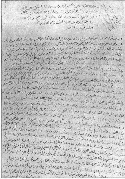
Habib Karamânî vakfiyesinin ilk sayfası (VGMA, Mücedded Anadolu, XVIII, nr. 604, s. 227)

Caminin yanında kütüphane ve zâviye ile birlikte inşa edilen medresenin 1900 yılında altmış yedi talebesi bulunmaktaydı ( Salnâme-i Maârif-i Umûmiyye , I, 862).