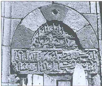
Hacı Halil Paşa Medresesi'nin kitâbeli batı penceresi

1930'lu yıllarda henüz görülebilen kalınlardan anlaşıldığı kadarı ile mescid kare planlı olup girişinde iki yanı duvarlarla kapalı bir son cemaat yeri vardı. Eski bir fo-