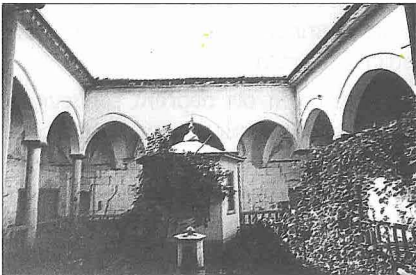
Hacı Halil Paşa Medresesi'nin avlusu - Gümüşhacıköy / Amasya

Avluyu örten, günümüze ulaşmamış kubbenin 12,50 m. çapında olduğu anlaşılmaktadır. Kubbeğe geçişi sağlayan tromplar muhdes revağın arkasında görülebilir. Üçgen biçiminde küçük taş konsollara oturan tuğla sivri kemerlere sahip olan bu trompların içleri, tuğla üzerine alçı uygulanması ile oluşturulan farklı