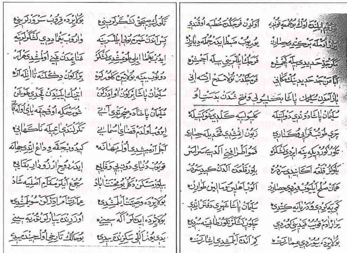
Hadîdî'nin Tevârih-i Âl-i Osmân 'ından iki sayfa (Tercüman Gazetesi Ktp., nr. Y 162)

Beşi Türkiye'de olmak üzere toplam yedi nüshası bilinen Tevârih-i Âl-i Os-