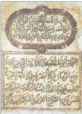
Senâî'nin Hadîkatü'l-hakîka adlı eserinin unvan sayfası ile ilk sayfası (Süleymaniye Ktp., Bağdatlı Vehbi Efendi, nr. 1672)