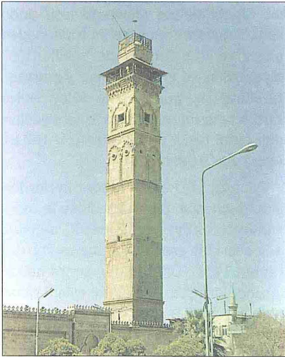
Halep Ulucamii'nin minaresi

Uzun süre bu görevde kalan Hâlet Efendi, II. Mahmud üzerindeki nüfuzunu