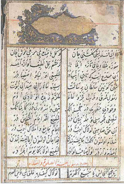
Fırkatnâme'nin ilk sayfası (Millet Ktp., Ali Emîrî Efendi, Manzum, nr. 1063)

men bu tarihi 866 (1461-62) olarak kaydetmiştir (HOP, II, 380).