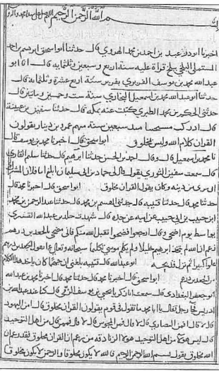
Halku ef'âli'l-ibâd 'in ilk ve son sayfaları (Süleymaniye Ktp., Refsülküttâb Mustafa Efendi, nr. 139/1)