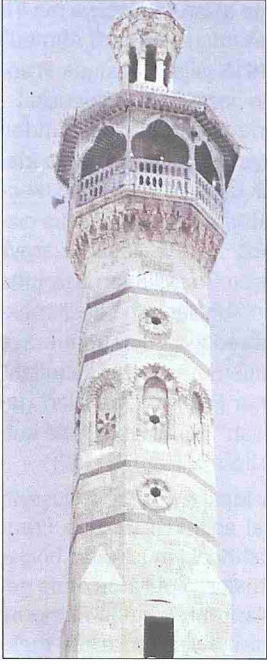
Hama Ulu Camii'nin minaresi – Suriye