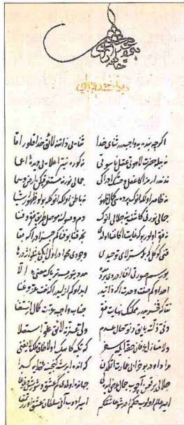
Hamdullah Hamdî'nin kendi hattıyla yazdığı nüshadan istinsah edilmiş divanının ilk sayfası (Süleymaniye Ktp., Esad Efendi, nr. 2626)

Hamdullah Hamdî, Yûsuf u Züleyhâ (haz. Naci Onur), Ankara 1991; Sehî, Tezkire , İÜ Ktp., TY, nr. 733, vr. 5 b ; Taşköprizâde, eş-Şekâik , s. 237; Mecdî, Şekâik Tercümesi , s. 250-251; Âşık Çelebi, Meşâirü's-suarâ , vr. 89 b -90 a ; a.e.,