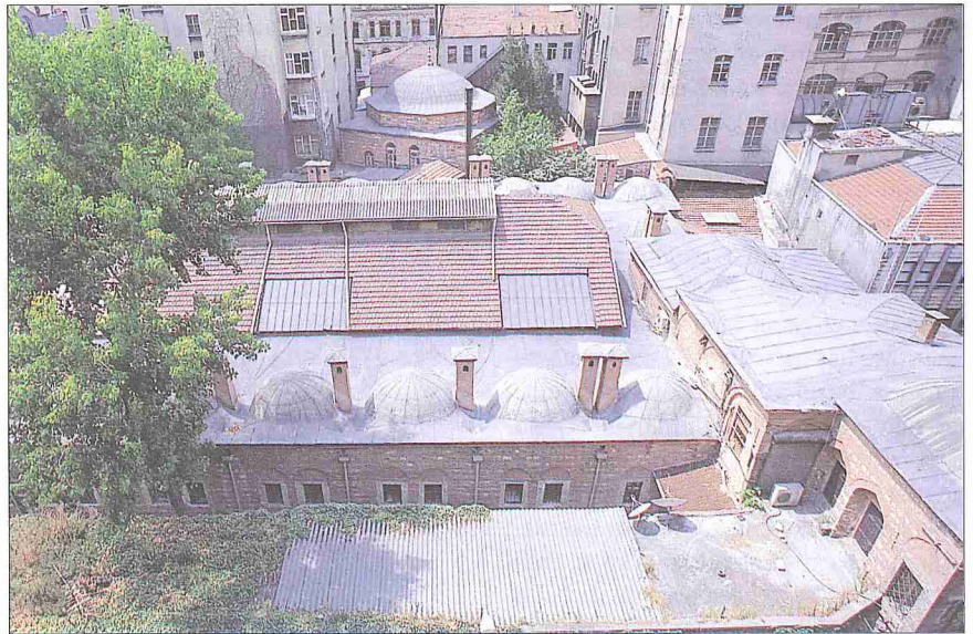
Hamidiye Külliyesi'nin medrese ve mescidi - Eminönü / İstanbul

Cami. Medresenin arkasında Büyük Postahane tarafında bir avlu duvarı ile çevrili olarak yer almıştır. İçinde bulunduğu yapı adası her taraftan binalarla kuşatılmış olduğundan cami dışarıdan görülmemektedir. Buraya medresenin içinden ve arka taraftaki Yeni Postahane cadesinden olmak üzere iki yerden geçilebilmekteydi. Son cemaat yeri bulunmayan camiye medrese avlusuna açılan kapıdan, bir tarafı taş ve tuğladan karma