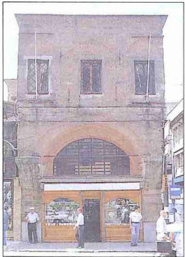
Hamidiye Kütüphanesi - Eminönü / İstanbul

Balmumcu'daki ana isâle hattından bugünkü Barbaros bulvarı yönünde devam eden ana kol Yıldız Sarayı'ndan önce birçok kola ayrılır. Batıdaki kol bugünkü yaya üst geçidinden önce batıya yönelir