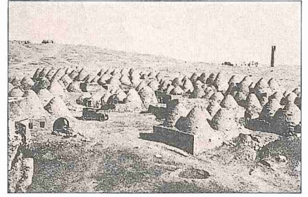
Harran'ın eski bir fotoğrafı (Albert Gabriel, Voyages archéologiques dans l'Anatolie orientale , Paris 1940, II, lv. CIII-1)

Harran 970'te Hamdânîler'in Musul koluna bağlandı. Ancak 980 yılı civarında Halep sahibi Sa'düddevl'e el-Hamdânî, Büveyhîler'in yardımıyla Harran'ı yeniden Halep Beyliği topraklarına kattı. 991'de Sa'düddevl'e ölünce Halep'e bağlı valiler istiklallerini ilân ettiler. Bu sırada Harran