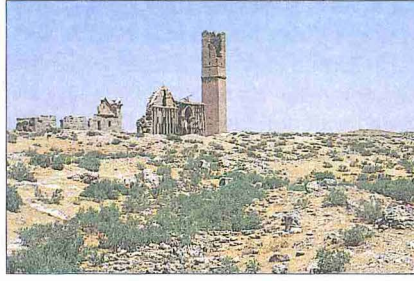
Harran Ulu Camii'nin kalıntıları

nin, 1149 yılında ise Nüreddin Mahmud Zengî'nin idaresine geçti.