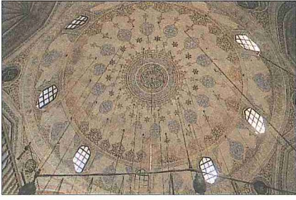
Haseki Camii'nin kubbe içinden bir görünüşü

yapının birlikte ele alındığına işaret etmektedir. Kapalı dershanenin hemen yanında küçük ve oldukça bakımlı bir hazire vardır. Mezar taşlarından çoğunun mütevellilere, külliye de hizmet eden kişilere ve onların aile fertlerine ait olduğu görülür.