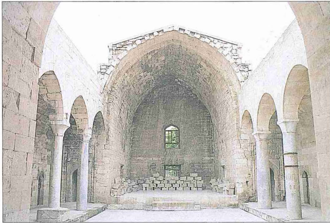
Karaman'da Hatuniye Medresesi'nin avlusu ve ana eyvanı

Kitâbesinde adı Hatuniye olarak geçmekle birlikte halk arasında kurucusuna nisbetle Sitti Radviyye (Radaviyye) adıyla da bilinen yapı Mardin'in Gül mahallesindedir. Tarihi boyunca fazla müdahale gör-