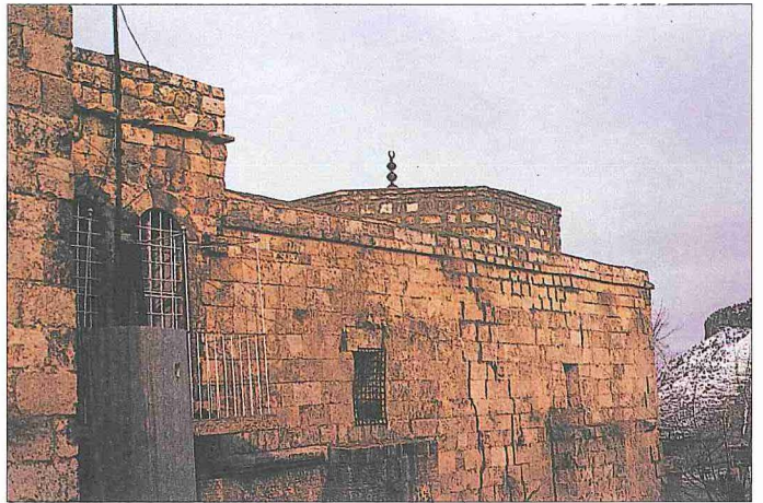
Hatuniye Medresesi - Mardin

Kur'an'da otuzu aşkın âyette zekâtтан, yetmiş yakın âyette de infaktan söz edildiği halde hangi tür malların ne ölçüde zekâta tâbi olduğu ve bu konudaki asgari sınır hakkında fazla bilgi verilmemiş, sadece temel ihtiyaçları belirlemeye yarayacak bazı ipuçlarının zikredilmesiyle yetinilmiştir. Meselâ, "Sana neyi infak edeceklerini soruyorlar; 'ihtiyaç fazlasını' (afv) de" meâlindeki âyet (el-Bakara 2/219; ayrıca bk. el-A'râf 7/199) dolaylı olarak havâic-i asliyye kavramına işaret eder. Nitekim İbn Abbas ve pek çok müfessir, söz konusu âyette geçen "afv" kelimesini "ailenin temel ihtiyacından arta kalan" diye tefsir etmişlerdir (İbn Kesîr, I, 373; Kurtubî, III, 61; İbn Hacer, XX, 184). Kur-