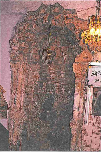
Hatuniye Medresesi türbe mekânının mihrabı

müş ve orijinal durumundan çok şey kaybetmiştir; bir kısmı bugün cami olarak kullanılmaktadır. Mardin Artuklu Hükümdarı II. Kutbüddin İlgazi'nin saltanatı sırasında (1176-1184) annesi Sitti Raziyye tarafından yaptırılmış ve vakfiyesi 602 (1206) yılında kible cephesine kazdırılmıştır. Kutbüddin İlgazi'nin de bu medreseye gömülü olduğu kaynaklarda belirtilmektedir. Nitekim mihraplı ana eyvanın doğusunda tromplu kubbe ile örtülü ve mihraplı türbe mekânında iki sanduka bulunmaktadır. Türbedeki taş işçiliği ana eyvandaki gibi dikkat çekicidir.