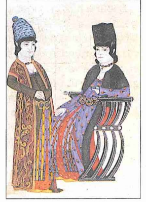
Haremde iki kadını tasvir eden bir minyatür (Abdullah-ı Buhârî Albümü , İÜ Ktp., TY, nr. 9364)

Harem, üzerinde en çok konuşulan ve çeşitli sanat eserlerine konu teşkil eden mensuplarının başında câriyeler gelir. Câriyelik pek çok yönden yanlış değerlendirilmiştir. Hukuken kadın köle statüsün- de olan câriyelerin esas kaynağı savaşlar- da alınan esirlerdir (bk. ESİR; KÖLE). An- cak bir süre sonra bu kaynağın yetersiz kalması sebebiyle İstanbul gümrük emi- nine satın aldırarak suretiyle câriye temi- ni yoluna gidilmiştir. Ayrıca çeşitli devlet ricâlî tarafından saraya ve padişaha he- diye edilenler de yekün tutuyordu. Câriye- lerin temini, seçimi, çeşitli zamanlardaki sayıları, satın alınmaları, ücretleri konula- rında Topkapı Sarayı Arşivi'nde bol mal- zeme bulunmaktadır. Bu câriyeler müs- lûman âdâb ve erkânı üzere yetiştirilir, kendilerine okuma yazma, dinî bilgiler öğretilir, yeteneklerine göre mûsiki, biç- ki dikiş, nakış dersleri verilir, ayrıca sofrâ hizmetleri öğretilirdi; acemilik denilen bu ilk dönemden sonra ilerleme göste- renler kalfa, usta seviyelerine yükselirdi. Haremde yüzlerce câriye olmakla birlik- te bunların büyük bir kısmı hizmetçi idi; padişah câriyelerin içinden sadece birkaç tanesiyle ilgilenir, diğerlerini ne bilir ne de görürdü. Harem hususunda yapılan araştırmalar, bu konudaki Osmanlı uygulamasının genel olarak İslâm hukukunun belirlediği sınırlar içinde cereyan ettiğini göstermektedir. Nitekim haremde hiz- metçi statüsünde bulunan câriyelerin bü- yük çoğunluğu teşkil ettiği, eş statüsün-