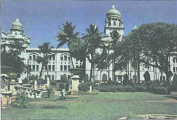
Osmâniye Hastahanesi - Haydarâbâd / Hindistan

Güneydeki Sind eyaletinde yer alır. Geniş toprakları ve barındırdığı yoğun nüfus ile Karaçi, Lahor, Faysalâbâd ve Ravalpindi'den sonra ülkenin beşinci büyük şehri konumunda olup aynı zamanda önemli bir endüstri ve ticaret merkezidir; Karaçi Limanı ile ülkenin kuzey kesimlerine demiryollarıyla bağlıdır. Haydarâbâd şehrinin merkez olduğu idarî bölge 87,7 km 2 yüzölçüme sahiptir ve Dâdû, Haydarâbâd, Badin, Sanghar, Thar Parkar ve Tatta adlı daha küçük idarî birimlere ayrılmıştır.