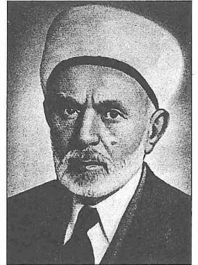
Eyüp Sabri Hayırlıoğlu

Türkiye Büyük Millet Meclisi II. dönem (1923-1927) Konya mebusu seçilen Eyüp