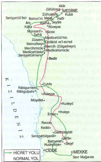
Hicret güzergâhını gösteren harita

Resûl-i Ekrem'in vefatından sonra ortaya çıktığına delâlet etmez; çünkü Kur'an-ı Kerîm'de olayın kendisinden çok onu gerçekleştirenlerin ve bu amellerinin önemine dikkat çekilmiş, ayrıca bu tabir hadisi pek çoğunda Mekke'den Medine'ye göç olayına işaret etmekte, ancak farklı anlamlarda kullanıldığı da görülmektedir. Meselâ bir hadiste, "Muhacir Allah'ın yasakladığı kötülük ve günahları terkeden kimsedir" denilmekte (Buhârî, "İmân", 4; Ebû Dâvûd, "Cihâd", 4, "Vitir", 11), başka bir hadiste de hicretin "kötü şeyleri terketmek" anlamına geldiği belirtilmektedir ( Müsned , IV, 114). Hicretin ahlâk ve zühd ile ilgisine işaret eden âyet ve hadisleri dikkate alan mutasavvıflar bu kavramı hem "haramları terk edip kötülüklerden uzaklaşmak", hem de "nefsi terbiye etmek maksadıyla yolculuğa çıkmak" veya "kalben ve zihnen halkı terketmek" anlamında kullanmış, seyrü sülûk dedikleri mânevî yolculuğu da bir çeşit hicret saymışlardır (Reşîdüddîn-i Meybûdî, I, 58).