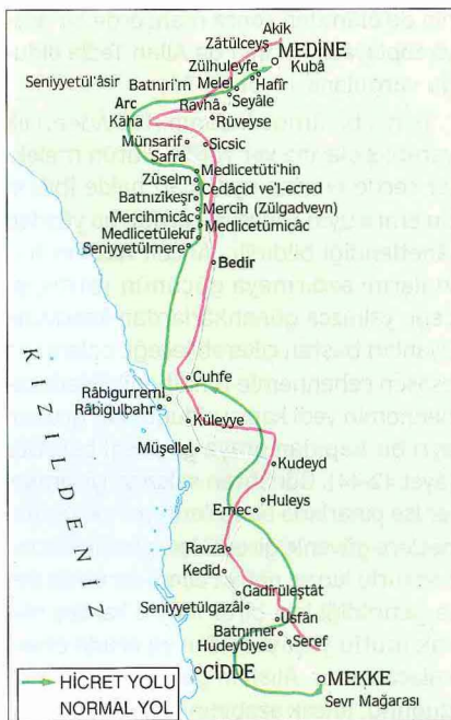
Hicret güzergâhını gösteren harita

Resûl-i Ekrem'in vefatından sonra ortaya çıktığına delâlet etmez; çünkü Kur'an-ı Kerîm'de olayın kendisinden çok onu gerçekleştirenlerin ve bu amellerinin önemine dikkat çekilmiş, ayrıca bu tabir hadisi pek çoğunda Mekke'den Medine'ye göç olayına işaret etmekte, ancak farklı anlamlarda kullanıldığı da görülmektedir. Meselâ bir hadiste, "Muhacir Allah'ın yasakladığı kötülük ve günahları terkeden kimsedir" denilmekte (Buhârî, "İmân", 4; Ebû Dâvûd, "Cihâd", 4, "Vitir", 11), başka bir hadiste de hicretin "kötü şeyleri terketmek" anlamına geldiği belirtilmektedir ( Müsned , IV, 114). Hicretin ahlâk ve zühd ile ilgisine işaret eden âyet ve hadisleri dikkate alan mutasavvıflar bu kavramı hem "haramları terk edip kötülüklerden uzaklaşmak", hem de "nefsi terbiye etmek maksadıyla yolculuğa çıkmak" veya "kalben ve zihnen halkı terketmek" anlamında kullanmış, seyrü sülûk dedikleri mânevî yolculuğu da bir çeşit hicret saymışlardır (Reşîdüddîn-i Meybûdî, I, 58).