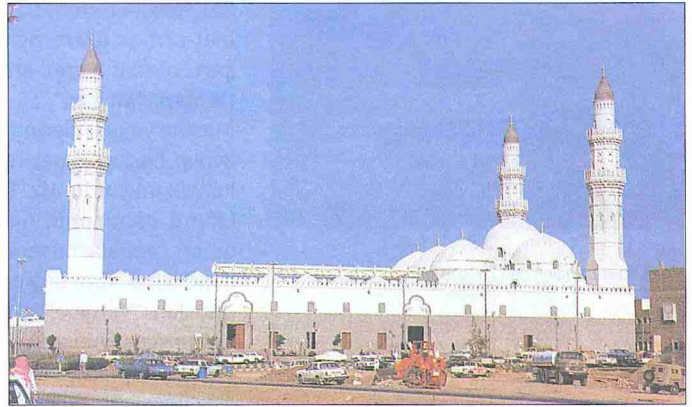
Kubâ Mescidi – Medine

Hz. Peygamber'in Mekke'den Medine'ye hicretiyle İslâm tarihinde yeni bir dönem başlamıştır. Hadise sadece bir mekân değişikliği boyutunda kalmamış, İslâm'ın daveti, teşri faaliyeti ve siyaseti açısından bir dönüm noktası olmuştur. Bu sebeple hicretin ve muhacirlerin değer ve şerefinden bahseden pek çok âyet ve hadis vardır. Meselâ bir âyette şöyle