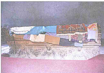
Hilfet Gazi Türbesi'nin üst katı içindeki lahdin güney yüzü

İkinci antlaşma hicretten otuz üç yıl (bazı rivayetlerde yirmi sekiz veya on sekiz yıl) önce yapılmıştır ve diğerinden daha ünlüdür. Mekke'de kabileler arasında zaman zaman çekişme ve çatışmalar oluyor, ayrıca dışarıdan hac ve ticaret için şehre gelen zayıf ve güçsüz kimselere haksızlık ve zulüm yapıyordu. Haram aylardan zilkadede vuku bulan böyle bir olayın Hilfü'l-fudûl'e yol açtığı rivayet edilmektedir. Zübeyd kabilesinden bir kişi umre için Yemen'den Mekke'ye geldi ve bir alıcı ile âdet olduğu üzere yanında getirdiği malların pazarlığını yaptı. Fakat alıcı malların parasını yapılan pazarlık üzerinden ödemek istemedi. Alıcının adı rivayetlerin çoğunda Âs b. Vâil es-Sehmî, İbn Habîb'in e'l-Münemmak 'ında ise (s. 275) Huzeyfe b. Kays es-Sehmî olarak verilmiş-