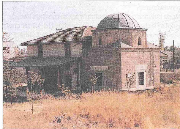
Hoca Fakih Mescidi ve Türbesi ile türbenin kitâbesi - Konya

618 (1221) yılında vefat eden Ahmed Fakih Kutbüddin adına aynı yıl Şeyh Aliman (Alaman) tarafından yaptırılmış olan türbe (Totaysalgır [1944], s. 33) batı yönünden mescide bitişiktir ve aralarında bir kapı bulunmaktadır. Bu kapının üstündeki Selçuklu sülüsü ile yazılmış dokuz satırlık Arapça kitâbenin aslında mezar sandukasına ait olduğu sanılmaktadır (kitâbe metni için bk. DİA , II, 66). Kare planlı türbenin üzerini tuğla ile örülmüş, eteği mukarnaslı kubbe örter. Duvarlar moloz taştan yapılmış, dışarıdan muntazam kesme taşlarla kaplanmıştır; taban altıgen tuğla döşelidir. Binanın üç cephesinde iki sıra halinde altı pencere bulunmak-