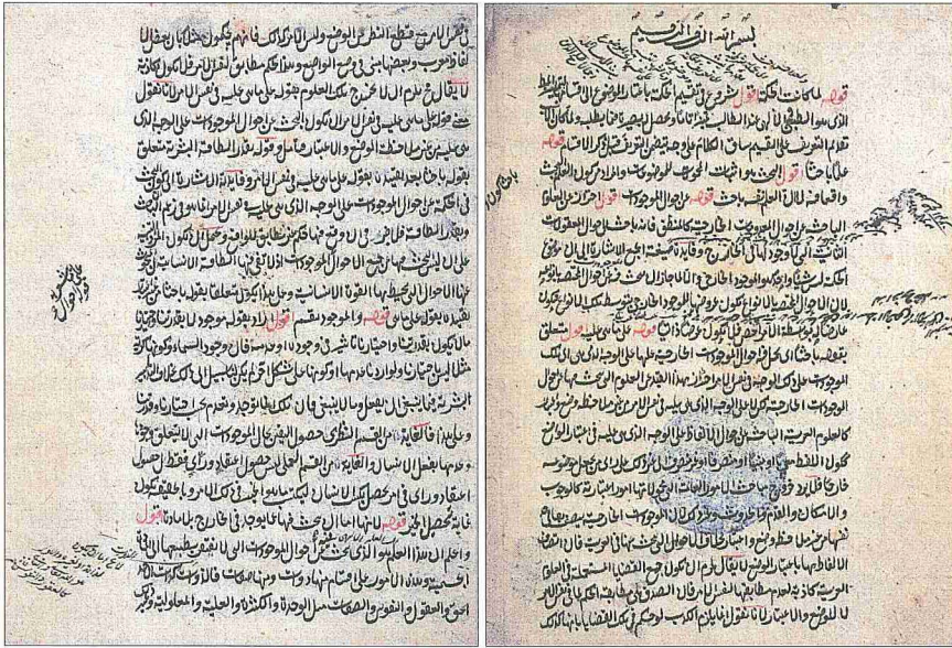
Hocazâde Muslihuiddin Efendi'nin Hâşiye 'alâ Şerhi Hidâyeti'l-hikme adlı eserinin ilk iki sayfası (Köprülü Ktp., Mehmed Âsım, nr. 269)

Ahmed b. Mahmûd el-Herevî'nin yazdığı şerhin hâşiyesidir (Süleymaniye Ktp., Lâleli, nr. 2211, vr. 260-289, nr. 2539, vr. 71-102, Hasan Hüsnü Paşa, nr. 1233, Ayasofya, nr. 4847, vr. 45-81; Konya Bölge Yazma Eserler Ktp., nr. 216; Beyazıt Devlet Ktp., nr. 3999; Köprülü Ktp., Mehmed Âsım, nr. 269). 3. Hâşiye 'alâ Şerhi'l-Mevâkıf li-Seyyid Şerîf el-Cürçânî. Adudüddin el-İcî'nin el-Mevâkıf adlı eserine Seyyid Şerîf el-Cürçânî tarafından yazılan şerhin hâşiyesidir. Müellifin vefatı üzerine kitap öğrencilerinden Molla Bahâeddin tarafından temize çekilmiştir. Eserin bazı nüshaları Süleymaniye Kütüphanesi'nin yanı sıra (Amcazâde Hüseyin Paşa, nr. 302; Bağdatlı Vehbi Efendi, nr. 826, 248-333 varaklar arasında bulunmaktadır; Cârullah Efendi, nr. 2119; Damad İbrâhim Paşa, nr. 784; Hüsrev Paşa, nr. 122) Beyazıt Devlet (nr. 2878) ve Tire (Necip Paşa, nr. 167) kütüphanelerinde bulunmaktadır. 4. Hâşiye 'alâ Şerhi't-Tavâli' li'l-İşfahânî. Kâdî Beyzâvî'nin Tavâli'u'l-envâr adlı eserine Mahmûd b. Abdurrahman el-İsfahânî tarafından yazılan şerhin hâşiyesidir (Süleymaniye Ktp., Şehid Ali Paşa, nr. 1597; Hüsrev Paşa, nr. 122). Hüsrev Paşa nüshasında eserin adı Hâşiye 'alâ'l-İşfahânî fi 'ilmi'l-ke'lâm şeklinde yazılmış olup bu nüsha Şehid Ali Paşa'daki nüshadan farklıdır. Muhtemelen bu eser İsfahânî'nin kelâm konusundaki başka bir