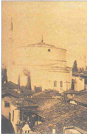
Hortaçî Süleyman Camii’nin XX. yüzyıl başına ait iki fotoğrafı

Selânik 1912 yılında elden çıktıktan sonra şehirdeki diğer kiliseden çevrilme camiler gibi Hortaçî Camii de kiliseye dönüştürülmüştür. 1923’te binada Anadolu’dan gelen Rum göçmenler barındırılmış, daha sonra da müze haline getirilmiş, bu arada içinde arkeolojik araştırmalar yapılmıştır. Selânik Yunan hâkimiyetine geçtiğinde şehirdeki cami ve mes-cidlerin hepsinin minareleri yıktırılmışken yalnız Hortaçî Camii minaresi, Türk ve müslüman idaresine karşı kazanılan “zafer” in işareti olmak üzere külâhsız muhafaza edilmiştir. 1953’teki ziyarette binanın içinde Türk dönemine işaret eden en ufak bir iz bırakılmamış olduğu görülmüştü. Yalnız girişin üstünde dört kartuş içinde cami inşa tarihi kitabesiyle 1245 (1829-30) ve 1322 (1904) tarihli iki yazı görülebiliyordu. Bitişinde evvelce bir çeşmenin yer aldığı avlu duvarı da kaldırılmıştı. Hortaçî Camii’nin etrafını saran geniş hazredekî bütün mezar taşları ile asırlık ağaçlar bile ortadan kaldırıl-