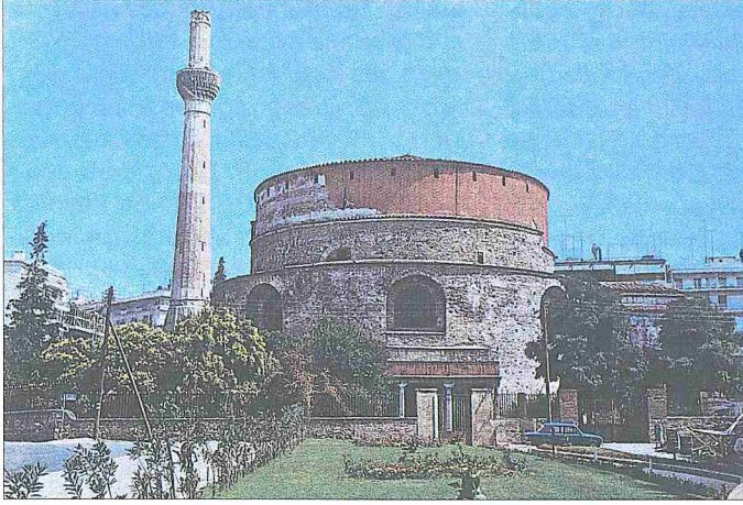
Hortacı Süleyman Camii – Selânik / Yunanistan

miştir. Yalnız binanın doğu tarafında mihrabın önünde, o yıllarda çatısı yıkılmış ve duvarları devrilmek üzere olan dikdörtgen biçimli büyük bir türbe vardı. İçinde Şeyh Süleyman Efendi'nin taşsız lahdinden başka şehrin çeşitli yerlerinden toplanarak buraya konulmuş birkaç parça Osmanlı dönemi mezar taşı bulunuyordu.