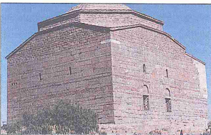
Hudâvendigâr Camii - Behramkale / Çanakkale