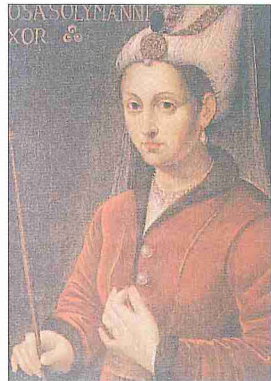
Hürrem Sultan'ı tasvir eden yağlı boya tablo (Jak Arram özel koleksiyonu)

Sarayda tam bir otorite kuran Hürrem Sultan, daha sonra kendi oğullarından birinin kocasından sonra padişah olması için mücadele etmeyi hayatının yegâne gayesi haline getirdi. O sıralarda oğulları için