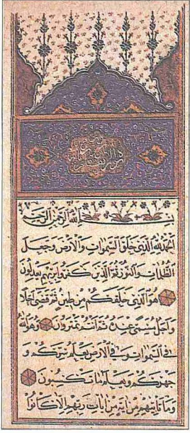
Hüsâmeddin Hüseyin Şah'ın nesih hattıyla yazdığı En'âm süresinin ilk sayfası (TSMK, Emanet Hazinesi, nr. 355)

93) Dîvân-ı Hümâyûn, 911'de (1505) Hazîne-i Âmire kâtipliğine tayin edildi. I. Selim'in tahta geçmesi üzerine (1512) hocası ile birlikte Alemdağ'ında inzivaya çekildi. Emekli olduktan sonra Üsküdar'da ikamet etti.