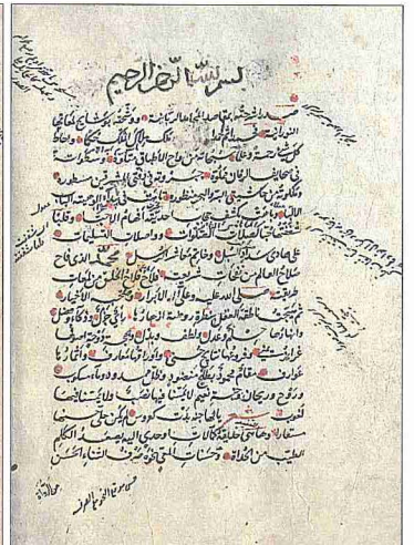
Hüsâmezâde Mustafa Efendi'nin Hâşiye 'alâ Şerhi'l- Makâsîd adlı eserinin ilk iki sayfası (Süleymaniye Ktp., Lâleli, nr. 2225/1)