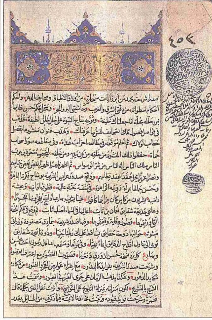
Hüsamzâde Mustafa Efendi'nin et-Teşrih 'alâ Şerhi'l-Vikâye adlı eserinin ilk iki sayfası (Süleymaniye Ktp., Hamidiye, nr. 453)

nefis gibi kavramların açıklanması, ikinci bölümde kadim sıfatların işaret ettiği hususlar, üçüncü bölümde zâtı, sıfatları ve fiilleri yönünden Allah'ın birleşmesi, dördüncü bölümde bazı sûre ve duaların fazilet ve özellikleri ele alınmıştır. Kitabın müellif hattıyla olan 889 (1484) tarihli bir nüshası Süleymaniye Kütüphanesi'nde bulunmaktadır (Hacı Mahmud Efendi, nr. 3121). Bu nüshanın son sayfasının kenarında, Hüsamzâde'nin daha küçük ebatla er-Risâletü'l-Şevkıyye adlı bir risâlesinin daha bulunduğu kaydedilmektedir. 7. Mecmû'atü'l-münşe'ât . Müellifin yazdığı inşâ ve mektupların derlenmesinden meydana gelmiş olup çoğu Arapça ve Farsça, az bir kısmı ise Türkçe'dir ( Hediyetü'l-ârifin , II, 439).