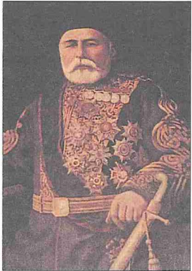
Hüseyin Avni Paşa

Bunlar iş başına geldikten sonra Abdülaziz'in hal'i konusundaki planlarını uygulamaya koyuldular. Bu konuda en faal rolü Serasker Hüseyin Avni Paşa oynadı. Kınardarlığıyla ünlü olan paşa Abdülaziz'e karşı intikam hırsıyla doluydu ve Isparta'ya sürülmesinin intikamını alacak zamanı kolluyordu. İlk önce saraya bağlı kumandanları İstanbul'dan uzaklaştırdı. Kendisine yakın bulunduğu kumandanlarla hazırladığı hal' planı konusunda hükümet üyelerini ikna etti. Paşalimanı'ndaki yalısında yapılan toplantıda hal' planının 31 Mayıs'ta uygulanmasına karar verildi (26 Mayıs 1876). Fakat beklenmedik bazı olaylar yüzünden uygulama 30 Mayıs'a alındı. Şehirde çıkan bir hareketi bastırmak ve padişahı korumak bahanesiyle asker, kışlasından çıkarılarak Dolmabahçe Sarayı karadan ve denizden kuşatıldı. Hüseyin Avni Paşa, Topkapı Sarayı'nda bulunan Velihaht Murad Efendi'yi bizzat arabasına alarak Serasker Kapısı'na getirdi. Burada beklemekte olan sadrazam, şeyhülislâm ve Midhat Paşa tarafından karşılanan yeni padişah Dolmabahçe Sarayı'na götürülerek tahta çıkarıldı. Eski padişah Abdülaziz önce Topkapı Sarayı'na, daha sonra da Feriye Sarayı'na nakledildi (1 Haziran