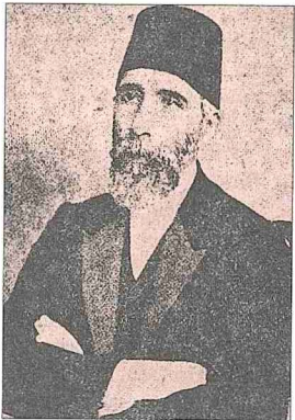
Hüseyin Hilmi Paşa

Hüseyin Hilmi Paşa'nın bu sadrazamlığı da pek başarılı olmadı. İkinci sadâreti Bosna-Hersek ve Bulgaristan meselelerinin halli, Adana'da çıkmış olan olayları yatıştırmak, asayişî sağlamak, Dîvân-ı Harb-i Örfî'nin kararlarını uygulamakla