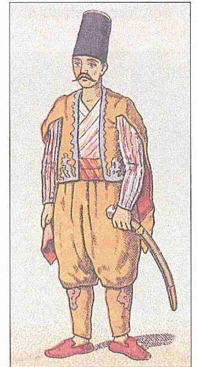
II. Mahmud döneminin humbaracı neferi (M. Şevket Paşa, Osmanlı Teşkilât ve Kıyâfet-i Askeriyyesi , İÜ Ktp., TY, nr. 9392)

Önceleri bütün topçu kuvvetleri gibi devrin ihtiyaçlarına cevap verecek durumda bulunan humbaracılık XVII. yüzyıldan itibaren ihmale uğramış, özellikle 1100'den (1689) sonra önemini iyice kaybetmeye başlamıştır. Bundan dolayı humbaracılığın Avrupa'daki gelişmesi göz önünde tutularak ıslahı düşünüldü. I. Mahmud zamanında humbaracıbaşı tayin edilen Fransız asıllı Ahmed Paşa (Comte de Bonneval) ıslah işiyle görevlendirildi. Veziriâzam Hekimoğlu Ali Paşa'nın sadrazamlığı döneminde 1146 (1733) yılın-