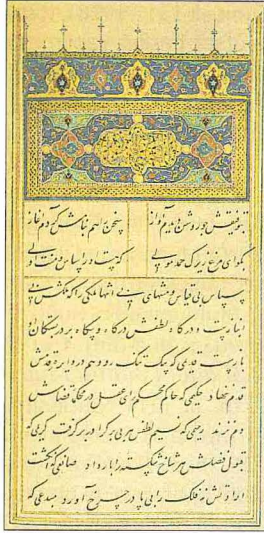
Hüseyinî Sâdât el- Gürî'nin Nüzhetü'l- ervâh adlı eserinin ilk sayfası (Nuruosmaniye Ktp., nr. 2633/2)

Hüseyinî Sâdât'ın cevaplandırılmasını isteyerek Tebriz âlimlerine gönderdiği sorular Mahmûd-ı Şebüsterî'nin (ö. 720/