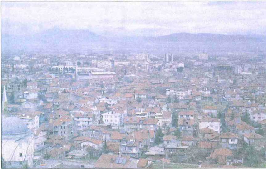
Isparta'dan bir görünüş

50.000'e ulaşmasını öngörüyordu. 1965 sayımında tesbit edilen 42.901 nüfus planda öngörülen rakama yaklaştı; fakat alan açısından büyüme pek düzenli olmadı ve özellikle kuzeydeki Bahçelievler, batıdaki Yayla, güneydoğudaki Gülcü ve doğudaki Karaağaç mahallelerinde tasarlanan sınırların dışına taştı. Bu sebeple 1968 yılında söz konusu aksaklıkları düzeltmek için başka bir plan hazırlandı ve eski planda fazla bir değişiklik yapılmadan sadece şehrin yeni gelişen kesimleri göz önüne alınarak yol ağı genişletildi. Burdur-Konya, Burdur-Antalya ve Konya-Antalya transit bağlantısını sağlayacak bir çevre yolunun önerilmesi 1968 planının en önemli özelliklerindendir.