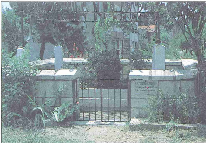
Ahmed Bican'ın açık türbesi- Celibolu/ Canakkale

XV. yüzyılda yaşayan Türk âlim, mutasavvıf, mütercim ve nâsirlerindedir. Yazıcıoğlu, Yazıcızâde veya nâdiren İbnü'l-Kâtib (Ahmed) dahi denilmekle beraber daha çok Bican lakabıyla meşhur olmuştur. Muhammediyye adlı manzum eseriyile tanınan Yazıcıoğlu Mehmed'in (ö. 855/1451) küçük kardeşidir. Babaları, Yazıcı (Kâtib) Sâlih'tir (Sâlihüddin?). Bu ismin eski veya yeni bir kısım eserlerde Selâhaddin şeklinde zikredilmesi yanlıştır (Çelebioğlu, s. 173 vd.). Bu bakımdan iki kardeş ve daha ziyade de Mehmed (Muhammed), Yazıcıoğlu lakabıyla şöhret kazanmıştır. Dedeleri, hakkında hiçbir bilgimiz olmayan Süleyman adında bir zattır.