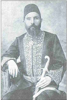
Serbestzâde Ahmed Hamdi

İskilip Ulaştepe mahallesinde doğdu. Babası Serbestzâde Hasan Efendi'dir. İlk öğrenimine İskilip Hacı Nuh Mekte-bi'nde başladı. Rüşdiyeyi de aynı yerde