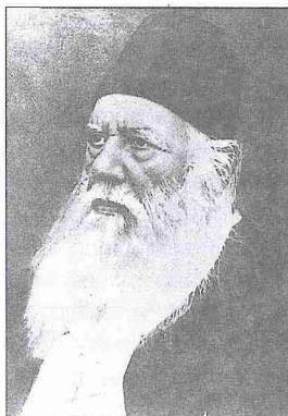
Seyyid Ahmed Han

Ahmed Han, 1869 yılında oğulları Hâmid ve Mahmud'la birlikte İngiltere'ye gitti. On yedi ay müddetle meslekî tetkiklerle birlikte İngiliz üniversite teşkilâtını da inceledi. Özellikle Kraliçe Victoria'dan ve İngiliz devlet adamlarından büyük ilgi gördü. Hindistan'a dönüşünde Tehzîbü'l-ahlâk adıyla aylık bir gazete çıkararak müslümanları Batı kültürüne ve İngiliz hükûmetine ısındırarak için çaba gösterdi; din ile dünya işlerinin birbirinden ayrılması ve dinin her işe karıştırılmaması gerektiğini savundu. 24 Mayıs 1875'te, Kraliçe Victo-