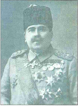
Ferik Ahmed Muhtar Paşa

teb-i Mülkiyye-i Şâhâne'de topçulukla ilgili dersler verdi. Miralay rütbesine yükseldiği sırada hocalık görevine ek olarak Umum Topçu ve İstihkâm Komisyonu âzâlığına tayin edildi (1895). Beş yıl sonra, Mekteb-i Fünûn-ı Harbiyye dışındaki hocalıklardan ayrıldı. 1902'de mir-liva, 1906'da ferik rütbesine yükseltildi. Sultan II. Abdülhamid tarafından Osmanlı ordusunun yeniden düzenlenmesi sırasında top, tüfek gibi bazı silâhların temini maksadıyla Almanya, Avusturya ve Fransa'ya gönderildi. Bu sırada Top-hâne-i Âmire müşiri Zeki Paşa'ya Avrupa müzeleri hakkında düşüncelerini bir yazı ile bildirerek Türkiye'de de bu mahiyette bir müze kurulmasını teklif etti. Bu teklifin Sultan II. Abdülhamid'e bildirilmesi üzerine padişah tarafından, Alman topçu ferîği Gramkov Paşa ve Hende-i Mülkiyye Mektebi hocalarından Alman mühendis Jasmund ile birlikte böyle bir müzenin kurulması için görevlendirildi. Bu çalışmalar sonunda Yıldız Sarayı'nda bir silâh müzesi (silâhâne) kurulduysa da bir süre sonra kapatıldı.