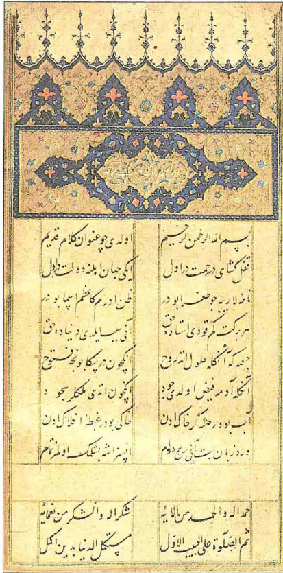
Bursalı Ahmed Paşa Divan 'ının ilk sayfası (Süleymaniye Ktp., Ayasofya, nr. 394)