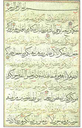
Ahzâb sûresinin muhakkak hattıyla yazılmış ilk âyetleri

Tamamı Medine devrinde nâzil olan sûre yetmiş üç âyetten ibarettir. Fâsıla 5 si, 4. âyetin sonundaki "lâm" harfi dışında "elif"tir. Adını, 20 ve 22. âyetlerinde geçen ahzâb kelimesinden almıştır. Ahzâb, "parça, kısım; cemaat; silâh ve harp aleti" gibi anlamlara gelen hizb kelimesinin çoğuludur. Bir Kur'an cüzünün dörtte birine de hizb adı verilir. "Onlar şeytanın hizbidirler" (el-Mücâdile 58/19) âyetinde olduğu gibi, bir kimsenin özel askerlerine, yakın adamlarına da hizb denmekle beraber sûrede geçen ahzâb kelimesiyle, Hz. Peygamber'e karşı savaşmak üzere toplanıp Medine'yi kuşatmaya gelen ve Hendek Gazvesi'ne sebep olan müttefik düşman kuvvetleri kastedilmiştir. Bu sebeple Hendek Gazvesi'nin bir adı da Ahzâb Gazvesi'dir. Bu savaşta Medine'yi ele geçirmeyi, Hz. Peygamber'i ortadan kaldırıp müslümanları toptan imha etmeyi hedef alan yahudilerle Mekkeli müşriklerin planı, Hz. Peygamber'in Medine çevresine kazdırmış olduğu bir hendekle engellendi. Bu olaydan sonra müşrikler bir daha müslü-