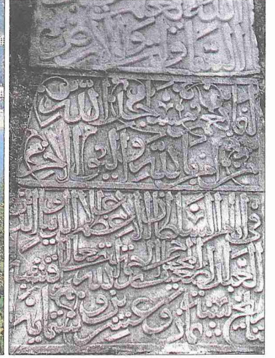
Akşebe Sultan Mescidi ve mescidin 628 (1231) tarihli inşa kitâbesi - Alanya / Antalya

lunmaktadır. Tonozlu bölümün türbe olduğu ve eskiden burada üzeri çini kaplamalı bir sandukanın yer aldığı tahmin edilmektedir. Bu ek yapı, sonradan örülerek kapatılmış üç açıklıkla ana yapıya bağlıdır.