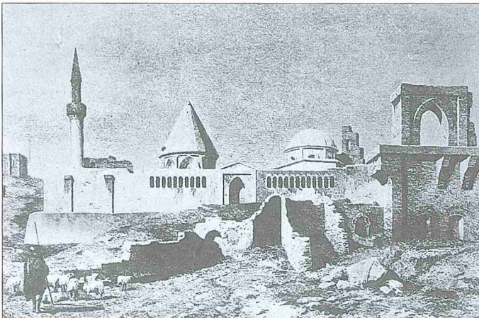
Alâeddin Köşkü kalıntılarını ve Alâeddin Camii'ni gösteren bir gravür (Ch. Texier, Description de l'Asie Mineure , Paris 1839-1849, s. 100)

Anadolu'da Selçuklu Türkleri'ne ait bu çok güzel ve değerli sanat eserinin tahribi, medeniyet tarihimizde yeri dolurulamayacak bir kayıptır.